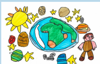
Carte des vœux : Ilinca Torchet

insieme-Genève vous souhaite un joyeux Noël et de belles fêtes de fin d'année !